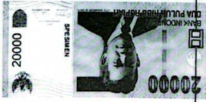
10. Perhatikan gambar uang berikut ini: